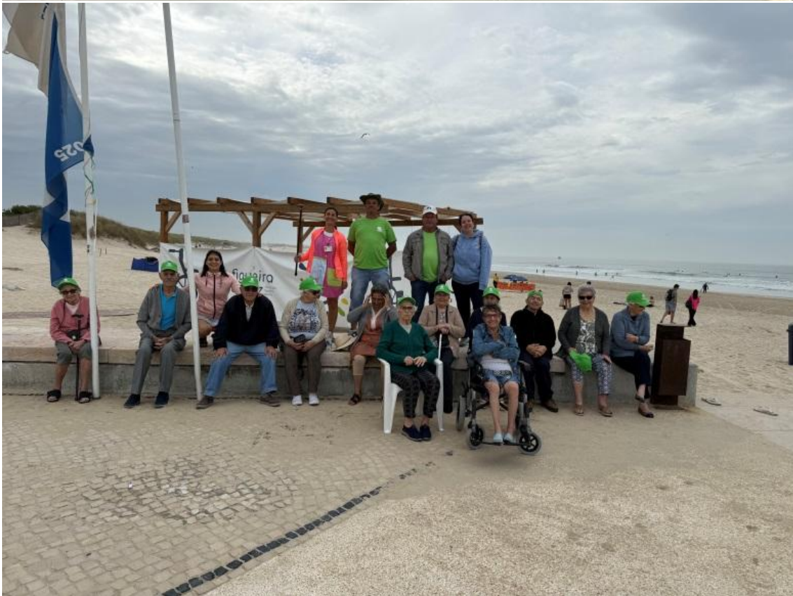
Figura 2 - Atividades realizadas com os nossos utentes